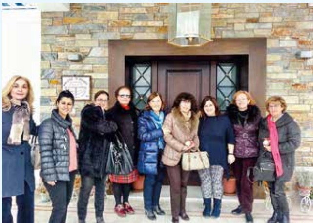
Μέλη της Θέτιδας στην «Κιβωτό του Κόσμου»

Σ.Ο. ΒΟΛΟΥ ΘΕΤΙΣ: Στις 10 Ιανουαρίου επισκεφθήκαμε την «Κιβωτό του Κόσμου» στο Διμήνι Βόλου, με σκοπό να συ-