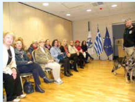
Από την επίσκεψη στο Μουσείο Αστυνομίας Βόλου.

Στις 15 Μαρτίου τα μέλη των δύο Σ. Ομίλων Βόλου, μετά από πρόσκληση του Αστυνομικού Διευθυντή, ξεναγηθήκαμε στο νεοϊδρυθέν Μουσείο Αστυνομίας Βόλου. Ήταν μια