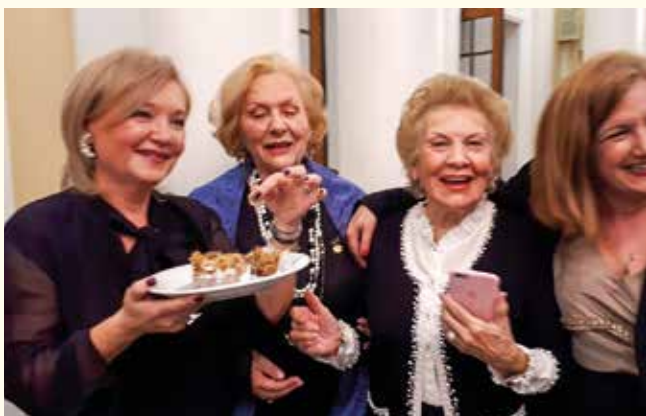
Τα μέλη του Σ.Ο. Ανατολικός χαίρονται το «Φλουρί» τους