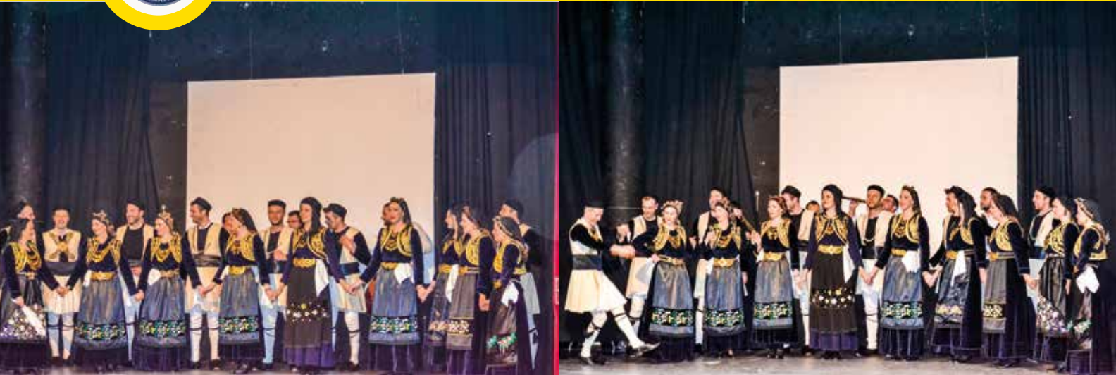
Η χορευτική ομάδα του Συλλόγου Βλατσιωτών Λάρισας επί σκηνής