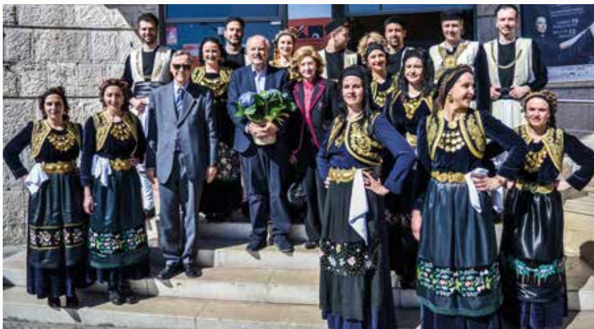
Χορευτές και Ομιλητές προ της αίθουσας της «Αλέξανδρος» μετά το πέρας της εκδήλωσης.