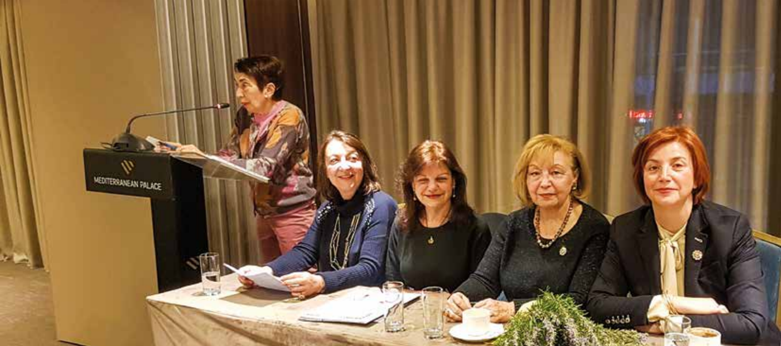
Η Α' Αντιπρόεδρος της ΣΕΕ Πηνελόπη Ράλλη στο βήμα. Στο πάνελ διακρίνονται οι Πρόεδρος, Γ. Γραμματέας, Διευθύντρια και Β. Διευθύντρια της ΣΕΕ.