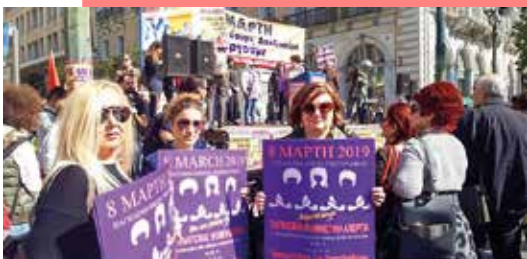
8 Μαρτίου στην Αθήνα