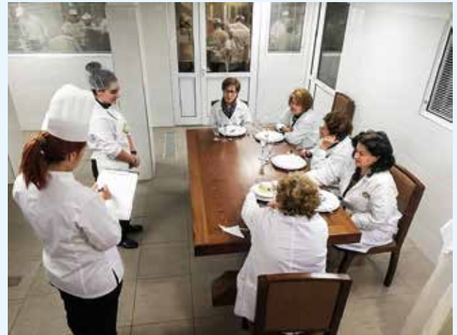
Master chef «Αρετούσα»- Ο Όμιλος σε στιγμές γευσιγνωσίας

Στις 5 Οκτωβρίου του 2018 συμμετοχή στην Ημερίδα «Η επίδραση της κλιματικής αλλαγής στα μνημεία», την οποία διοργάνωσε η Εφορεία Αρχαιοτήτων Ηρακλείου και το Ίδρυμα Τεχνολογίας και Έρευνας (ΙΤΕ). Στις 17 Οκτωβρίου συμμετοχή στην βραδινή συνεστιάση, μετά μουσικής, του Πολιτιστικού-Φιλανθρωπικού Συλλόγου «Ερωφίλη». Στις 9 Νοεμβρίου 2018 συμμετοχή του Ομίλου στην Πανελλήνια Συνάντηση Εργασίας Προέδρων, Διευθυντριών Προγραμμάτων και Βοηθών Διευθυντριών Προγραμμάτων. Στις 1-2 Δεκεμβρίου 2018 συμμετοχή στην Διημερίδα «Αυτοάνοσα Νοσήματα και Διατροφή», η οποία έγινε από τον ιατρό νευρολόγο Γεώργιο Σπανάκη. Με αφορμή τη Παγκόσμια Ημέρα του παιδιού 7 Δεκεμβρίου διοργανώσαμε στις 11 Δεκεμβρίου μια γιορτή για τα παιδιά του Παιδικού Χωριού SOS Κρήτης. Στην επίσκεψη αυτή ήταν καλεσμένοι και άλλοι πολιτιστικοί σύλλογοι,