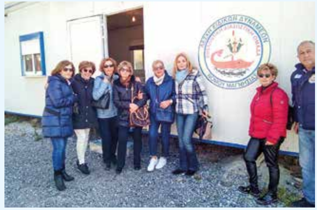
Από την επίσκεψη στις εγκαταστάσεις της Λέσχης Ειδικών Δυνάμεων Μαγνησίας.

Στις 14 Ιανουαρίου ανεβάσαμε στο you-tube το βλεπτο νίδιο του θεατρικού δρώμενου για τη βία κατά των γυναικών, στα πλαίσια της προβολής της δράσης της Θέτιδας