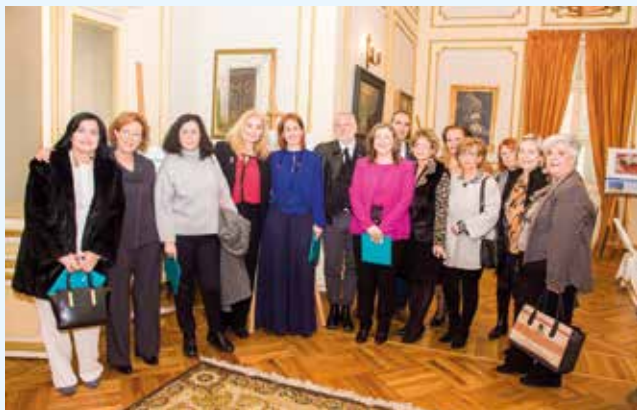
Από την επιστημονική ημερίδα με την ΑΚΟΣ. Στο βάθος έργα ογκολογικών ασθενών.

Σ.Ο. ΘΕΤΙΣ ΒΟΛΟΥ: Στις 3 Φεβρουαρίου με πρωτοβουλία του Ομίλου μας και σε συνεργασία με την ΑΚΟΣ-«θεραπεία σώματος και ψυχής» (επιστημονική μη κερδοσκοπική εται-