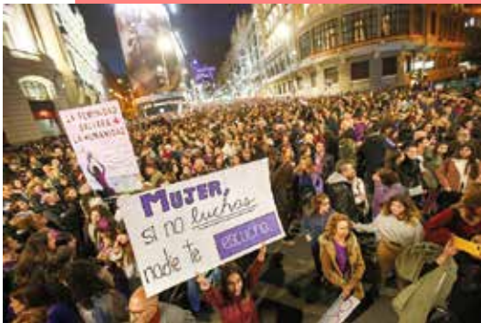
8 Μαρτίου στην Ισπανία