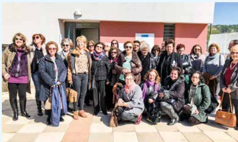
Ο Σ. Όμιλος Ρεθύμνου «Ερωφίλη» και φίλες στο Παιδικό χωριό S.O.S. Ηρακλείου

η οποία ζει μαζί με τα παιδιά σ' ένα σπίτι,