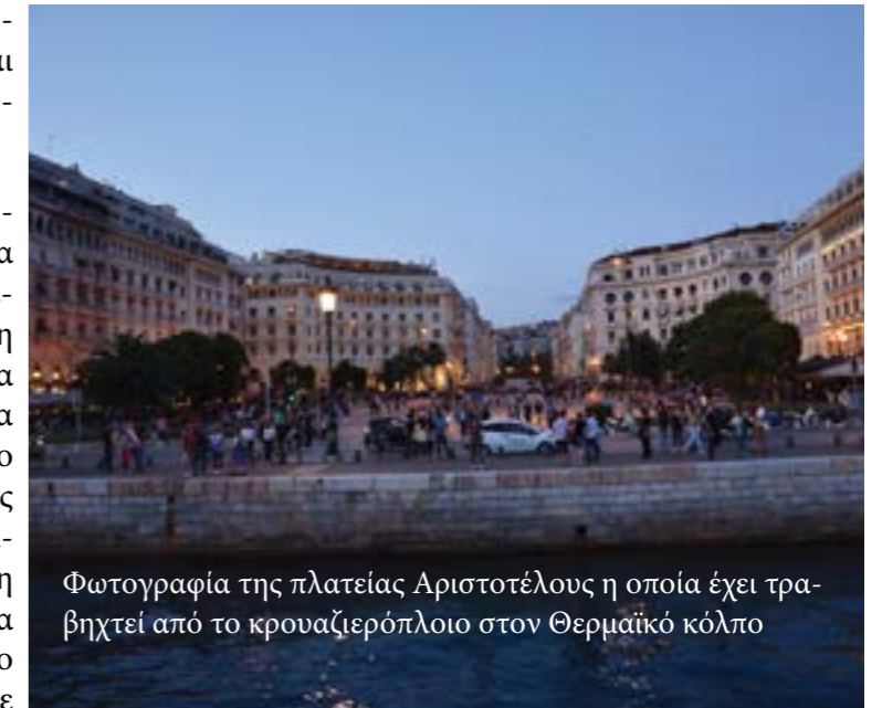
Φωτογραφία της πλατείας Αριστοτέλους η οποία έχει τραβηχτεί από το κρουαζιερόπλοιο στον Θερμαϊκό κόλπο